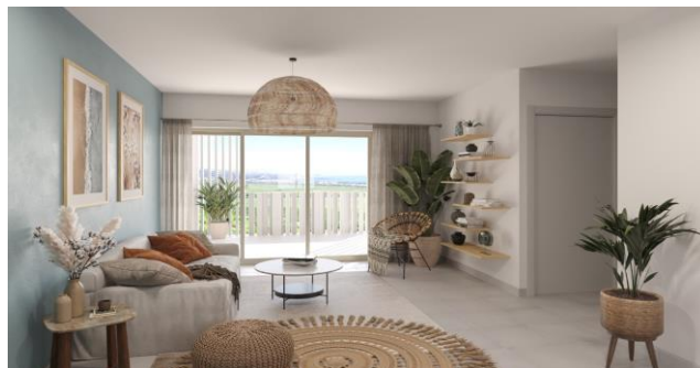
Résidence Bengali à Saint-Paul

Dans le Sud-Ouest de l'île, CBo Territoria développe à Saint-Leu pour le compte de la SHLMR (Groupe Action Logement) la résidence Le Jade à Roche Café (31 lots) en Logement Locatif Intermédiaire et en Logements Locatifs Très Sociaux ainsi que Pierre de Lune, 12 maisons individuelles de type F4 en PSLA. Le Prêt Social de Location-Accession (PSLA 2 ) facilite l'accès à la propriété des ménages modestes sans apport initial. Ces deux opérations seront livrées fin 2024.