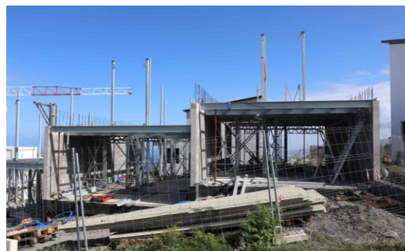
Résidence Le Jade et résidence Pierre de Lune à Roche Café

Dans le Sud de l'île, CBo Territoria a commercialisé au premier trimestre 2023 la première tranche du lotissement Kaisary (29 terrains à bâtir) dans le quartier à vivre Cap Austral à Saint-Pierre. Compte tenu du succès remporté, le Groupe s'apprête à lancer la commercialisation de la seconde tranche composée de 20 parcelles vue mer.