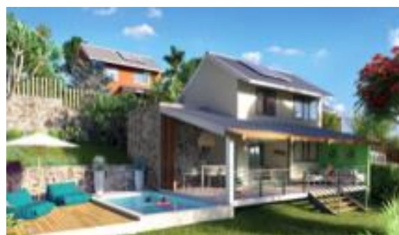
Lotissement Kaisary à Cap Austral